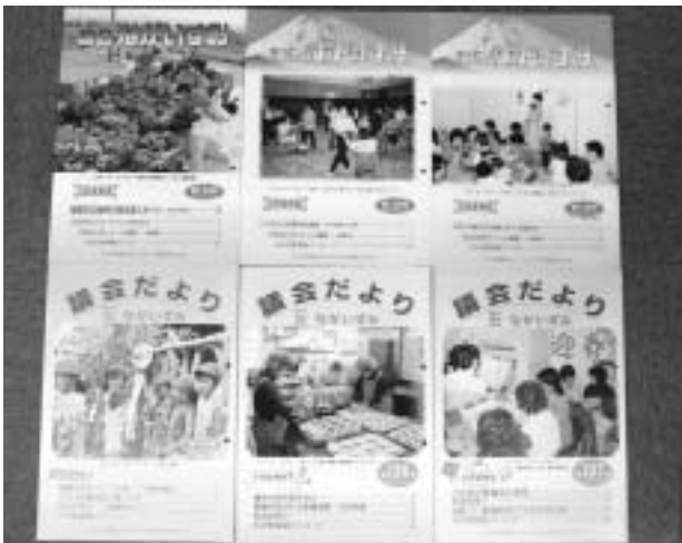
■定例会でのできごとをお知らせする広報紙です。 （年4回発行）